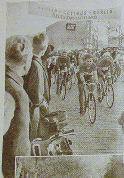
◀ Es geht los . . .