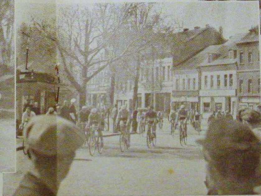
▲ Über sonnige Straßen durch märkische Landschaft fahren sie dem Wendepunkt entgegen, von jung und alt gespannt erwartet.